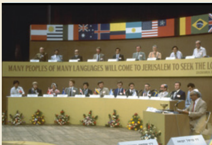
חידון התנ"ך הבינלאומי, תיאטרון ירושלים 1981

דוד בן-גוריון היה מעריץ נלהב של התנ"ך בפרשנות הפשט, ואימץ את התנ"ך כבסיס היסטורי, משפטי ומוסרי של שיבת עם ישראל לארצו. התנ"ך היה חלק מתפיסתו הממלכתית של בן-גוריון, שהפך את התנ"ך "לאבן התשתית של השקפת עולמו" תוך שלילת היהדות הגלוית על כל גילוייה. עם ישראל בתקופת המקרא היה בעיניו דגם ומופת לריבונותו של עם ישראל בארצו, ואילו הגלות - ביטוי לפסיביות של העם, לתלותו בזרים ולהיעדר כושר היצירה. בן-גוריון ראה בתנ"ך את "יצירתו הגדולה והנעלה ביותר של העם היהודי מבחינה לאומית, היסטורית, דתית ותרבותית, וכן מבחינת המוסר הכלל עולמי". וכל יהודי, מאמין או כופר בעיקר, אמור למצוא בתנ"ך "את מקורותיו, שורשיו ההיסטוריים והמוסריים".