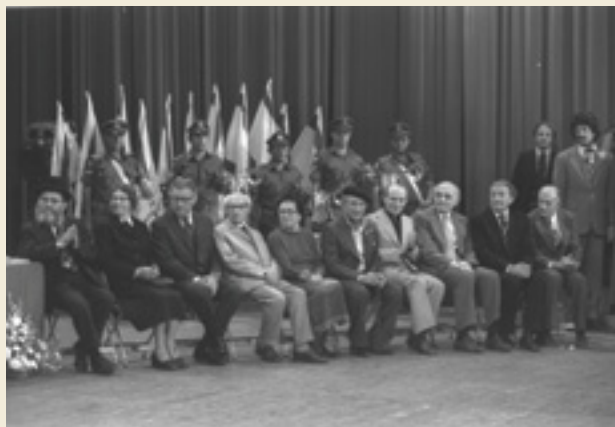
טקס פרס ישראל, תאטרון ירושלים 1.5.78

הסבירו את הקשר בין הענקת פרס ישראל ליום העצמאות. מה דעתכם על קשר זה? הציעו תחומים שבהם ראוי, לדעתכם, להעניק את פרס ישראל. הסבירו את בחירתכם.