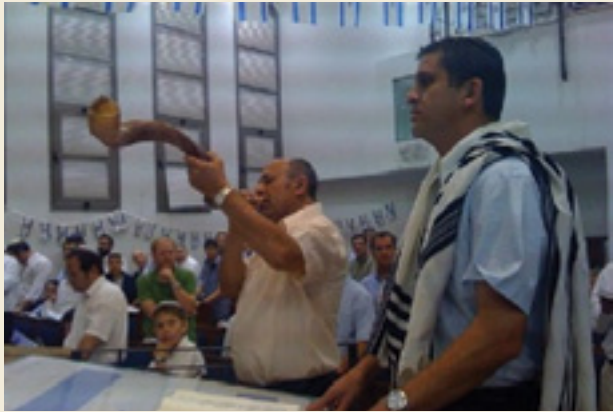
"תקע בשופר גדול לחרותנו..." יום העצמאות בבית הכנסת, אתר דתילי צלם: ד"ר מוטי גולן

מה חשוב בימינו: לשמר מנהגים ציבוריים ביום העצמאות או לטפח מסורות אישיות ומשפחתיות? מדוע?