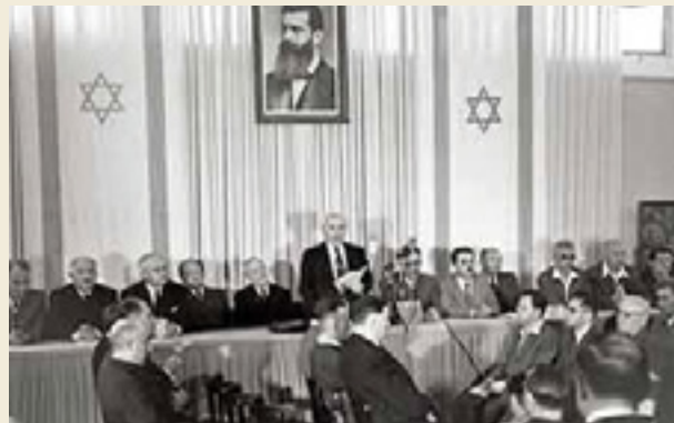
דוד בן גוריון קורא את מגילת העצמאות במוזיאון, תל אביב.

אתם ה"דורות הבאים" שאליהם בן-גוריון מתייחס בדבריו. האם המשימה שבן-גוריון מגדיר בדבריו כבוצעה? מהו התפקיד שלכם בהשלמת משימה זו? מדוע הייתה התלבטות לגבי ההכרזה על הקמת המדינה? שערו מדוע החליט בן-גוריון להכריז על הקמתה למרות הכול?