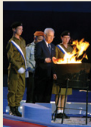
טקס הדלקת המשואות בהר הרצל שנת השישים למדינת ישראל 30.4.06

"טקסים משמשים אותנו על מנת להגדיר מי אנחנו ומה מערכת הגומלין הקיימת בינינו לבין אחרים, ובינינו לבין העולם כולו". - האם טענה זו נכונה לגבי טקסים הנהוגים בראש השנה, פסח, יום העצמאות? מדוע?