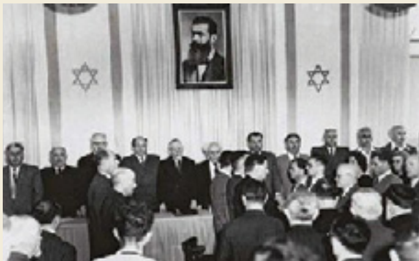
תפילת "שהחיינו" ושירת התקווה בסיום טקס ההכרזה

אילו מאפיינים של הטקס נשמרו על אף החיפזון והאלתור? (היעזרו בתמונות ובטקסט לאיתור המידע). איזו תחושה מעוררת הידיעה שהטקס שבו "נוסדה" מדינת ישראל היה כה צנוע וקצר? אילו תכונות ועמדות משקף הטקס (חשבו הן על המארגנים והן על הקהל)? האם חל שינוי משמעותי מאז? מה דעתכם על כך?