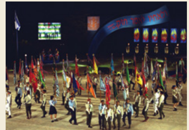
טקס יום העצמאות הר הרצל 23.4.01