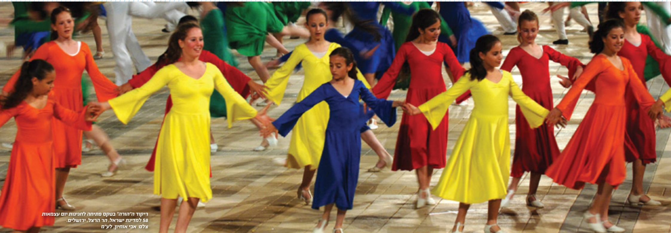
ריקוד ה"הורה" בטקס פתיחה לחגיגות יום עצמאות 58 למדינת ישראל, הר הרצל, ירושלים.

כתיבה ועיבוד: רותי זוסמן הפקה: לוראנס רוזנרט ייעוץ פדגוגי: ציפי קוריצקי, שרה שי הוצאה לאור: משרד החינוך - גף פרסומים