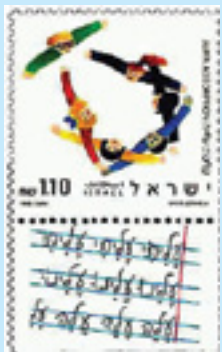
קליטת עלייה 4.9.90

מהי משמעות המגן דוד בתמונת הבול? אילו ערכים חרתה מדינת ישראל על דגלה ע"פ בול זה?