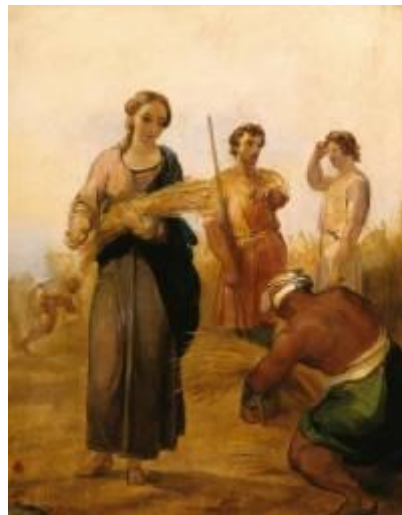
רות ובועז - ציור מאת ווטס

אבל, הסיבה העיקרית לאהבת השבועות היא המגילה השמורה לו - מגילת רות, שהיא בעיני החיבור המקראי היפה ביותר והנאצל, מקור קבוע ונובע להשראה טובה של יהדות מופלאה: לו היתה יהדותנו תמיד ברוח מגילת רות.